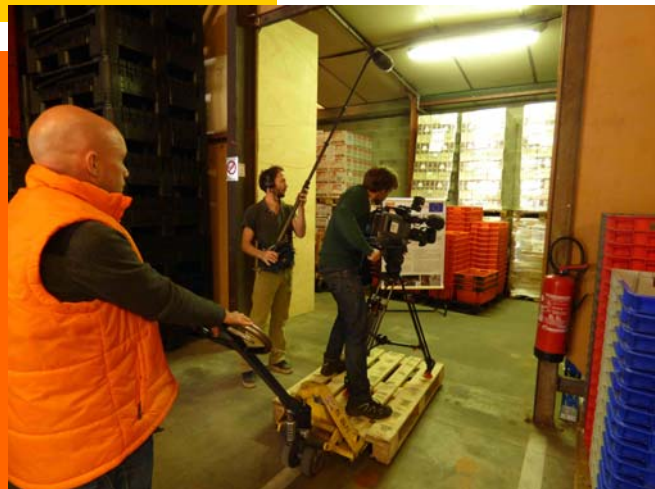
Le directeur en intermittent du spectacle

La Banque Alimentaire de l'Isère est née en 1986