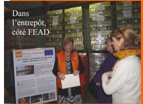
Dans l'entrepôt, côté FEAD