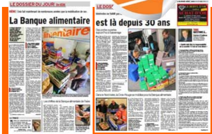
Deux pages sur le Dauphiné Libéré

Pour l'occasion, nous avons édité une série de 5 posters format A0 (119 X 84 cm), reprenant les grands thèmes de nos actions. Ces posters pourront être réutilisés lors de manifestations diverses..