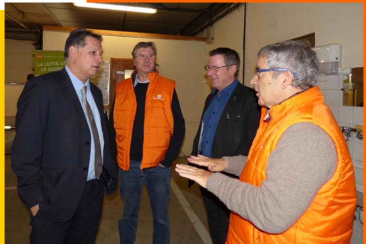
Visite du directeur de Carrefour St Eglise et du maire de Sassenage